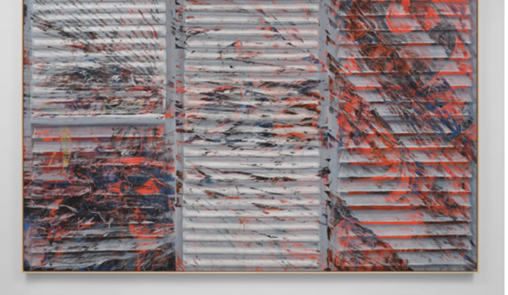
Angel Otero, Look out your Window, 2024. © Angel Otero. Cortesía del artista y de Hauser &amp; Wirth. Fotografía Thomas Barratt.

Realizada directamente sobre cartón, la última escultura de Martínez es una proeza de representación humanista. Retrato simbólico de una población en gran medida invisible de «trabajadores esenciales», las figuras del artista flotan sobre las marcas corporativas de la agroindustria -Sunkist, Nature Fresh Farms- junto con representaciones del fruto