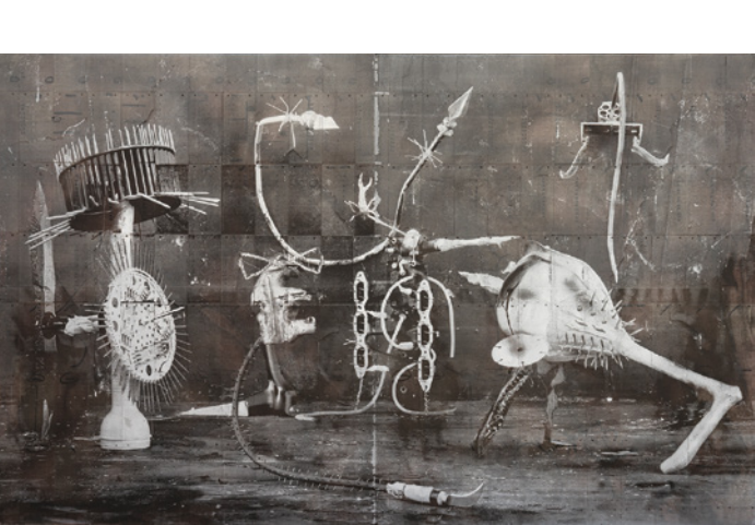
Rodrigo Valenzuela, Weapons #30, 2024.

Yiyo Tirado-Rivera es un artista multidisciplinar que emplea diversos materiales y medios, entre ellos el grabado, la fotografía, la instalación, la escultura, el neón, la arena y los libros tallados. Su obra aborda cuatro temas principales: la arquitectura, la construcción, la economía turística y la representación del Caribe como un paraíso.