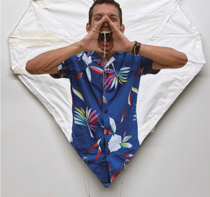
Miguel Luciano, Francisco, DREAMer Kite, 2012.

Laura Pérez Insuva es una artista interdisciplinar cuya obra explora las percepciones del poder a través de diversos medios. Utilizando sus experiencias en Cuba como prisma, Insuva se ha convertido en experta en analizar, criticar y retratar marcos políticos disfuncionales. El vídeo Hombre Nuevo (2021) -el título hace referencia al ideal sesentero de Ernesto «Che» Guevara- se inspira en los escritos de Noam Chomsky sobre la revolución y el cambio social. La película retrata una figura obstinadamente ideológica y contradictoria, un personaje «atrapado entre la esperanza y la desilusión». Entre las cuestiones que plantea la obra: ¿Qué ocurre con los sistemas de creencias fracasados? ¿, cuándo pasa la ideología a convertirse en mito?