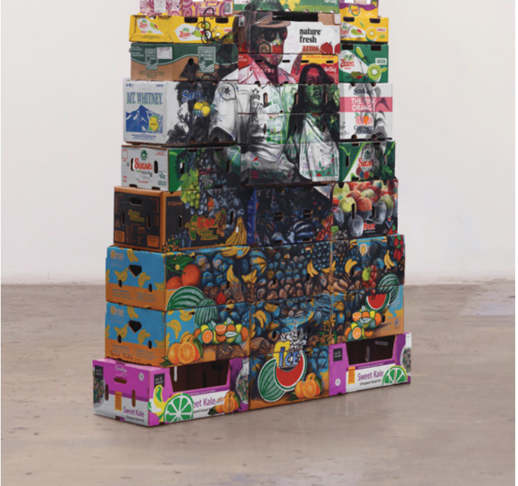
Nariso Martínez, Then and Now, Hope and Dignity, 2024. Cortesía del artista y de Charlie James Gallery, Los Angeles.

López utiliza lo que él denomina «big data, algoritmos de promediación y diversos medios impresos para crear composiciones collage a gran escala que tratan de encontrar sentido en un mundo caótico». Su extensa instalación In-Dependencia (2021-2022) consiste en un mural formado por dieciséis banderas, cada una de las cuales representa a un país latinoamericano. Encima de cada bandera hay impresa una representación en negro de